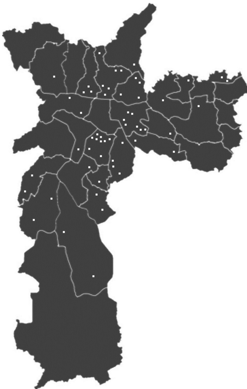
Figura 3: Localização dos centros incluídos no estudo nos bairros do município de São Paulo