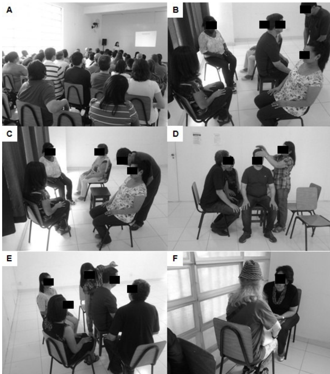
Figure 2: Spiritual interventions in FEESP.

A – Educational and Gospel lectures; B – ‘Disobsession group’. Patient was asked to pray from himself; C – disobsession group starts its work without the presence of the patient; D and E - ‘Passe group’. a worker apply the ‘passe’ (laying on of hands) in the patient; F – ‘fraternal assistance’. Patient is re-evaluated, advised to think positively, pray and to cultivate their spirituality at home.