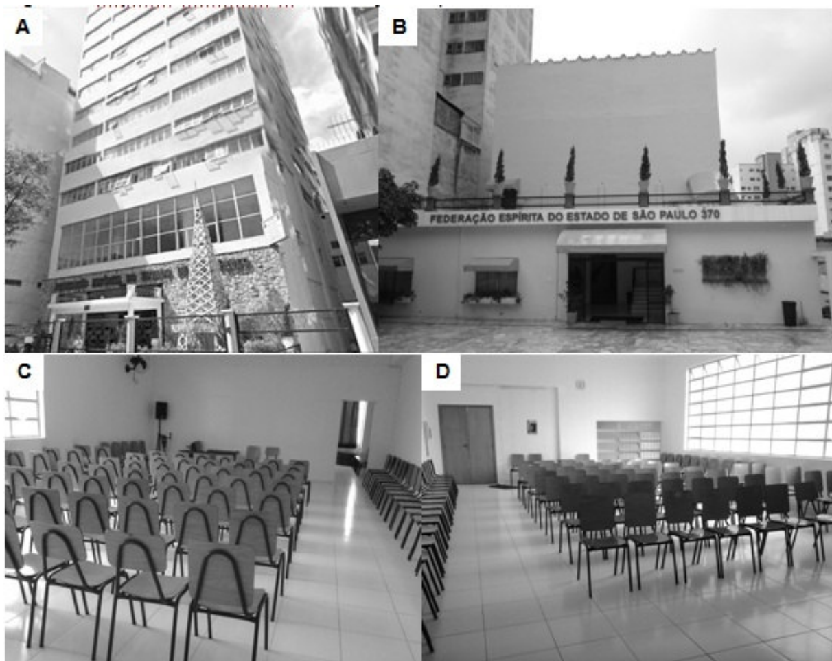
A – Main building; B – Spiritual healing depression treatment building; C and D – 80-seat room for the lecture