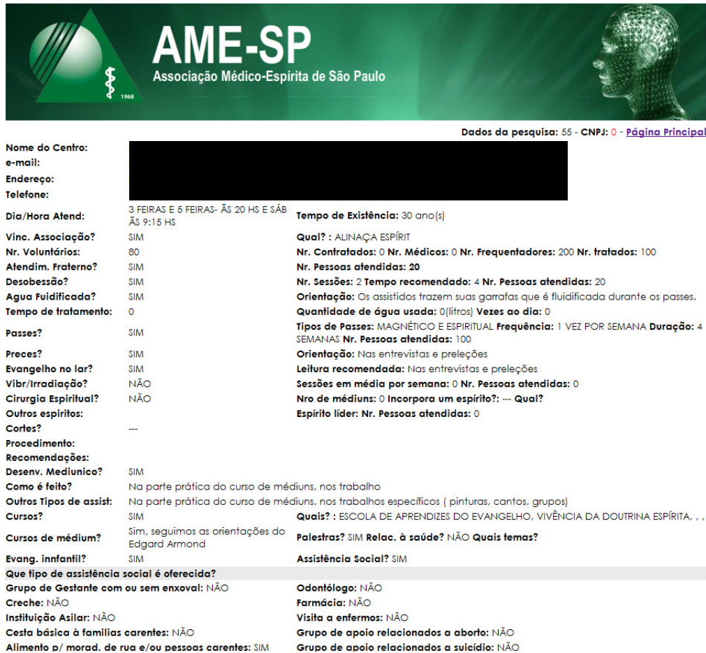
Figura 2: Dados de questionário respondido pelo site www.amesaopaulo.org.br